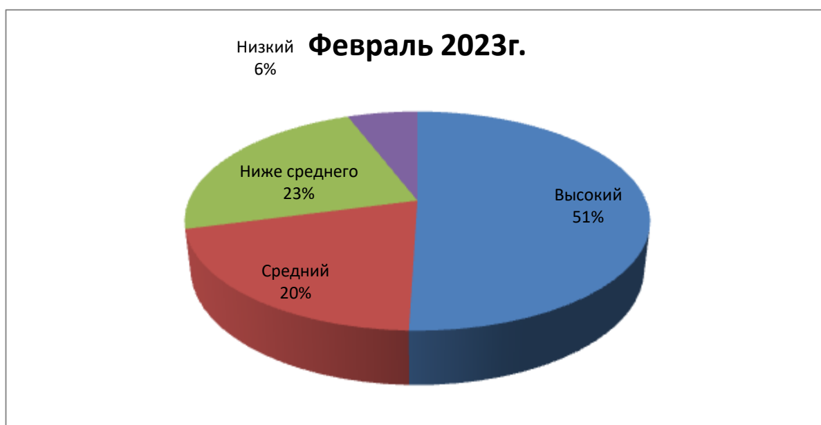
Рис. 3. Уровень развития познавательных УУД учащихся 2 класса

За шесть месяцев целенаправленной работы количество учащихся с низким уровнем развития познавательных УУД сошло на нет, уровень ниже среднего вырос на 5%, 36% детей перешли на высокий уровень его развития, количество учащихся со средним уровнем снизилось за счёт перехода на более высокую ступень развития.