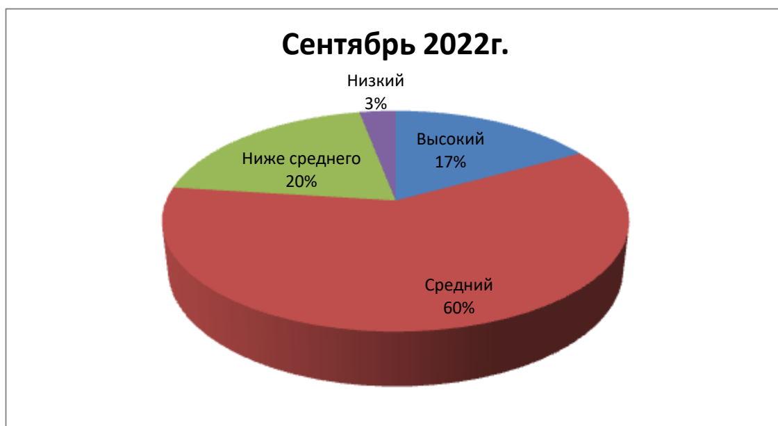
Рис. 2. Уровень развития познавательных УУД учащихся 2 класса

Следующие диаграммы (рис. 2 и 3) дают представление о динамике развития познавательных УУД учащихся в целом.